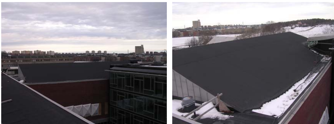
Figur 6. Bilderna visar den lanternin där solcellerna är tänkta att placeras. Anläggningen kommer inte synas från marken.

Akademiska hus påbörjade under hösten 2004 projektet att bygga om Konstfacks gamla lokaler i kvarteret Tre Vapen på Valhallavägen i Stockholm. Från början fanns solcellsinstallationen inte med i projektet men i och med att stödet för solceller introducerades väcktes tanken under sommaren 2005 och Akademiska Hus utredde möjligheterna att installera solceller på taket av byggnaden. Energibanken har gjort en förstudie för solcellsinstallationen som beräknas få en topp effekt på 31 kWp.