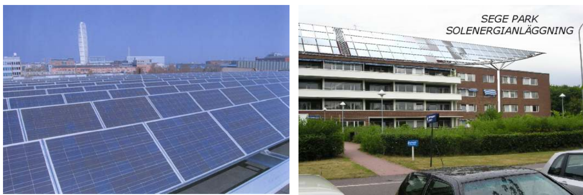
Figur 3. Till Vänster. Takanläggningen på Tekniska museet. Till höger. Illustration av den planerade anläggningen på Segepark.

Drivkrafterna för att genomföra solcellsprojekten har varit att Malmö Stadsfastigheter vill arbeta mer med energibesparing och genom att arbeta med solceller är det också ett sätt synas och skapa uppmärksamhet. Eftersom de tror tekniken kommer att bli viktig i framtiden tycker de också det är viktigt att vara tidigt ute och lära sig och utveckla kunskap om den nya tekniken. Det är också tydligt hur andra städers satsningar (Freiburg och Köpenhamn) har inspirerat och hjälp till att stärka Stadsfastigheters visioner. En viktig tanke med satsningen är att de själva vill att Malmö också ska bli en inspirationskälla för andra städer. Intrycket av Stadsfastigheters projekt är att det går smidigt utan några större problem och att det inte är några tveksamheter. En viktig orsak till detta är att satsningen har stöd både från ledningen i Stadsfastigheter och från politikerna i Malmö. Även om satsningen hade varit mycket svår att genomföra utan stödet så har den ekonomiska frågan varit mindre betonad i dessa projekt än i exempelvis Ulleviprojektet. Mycket på grund av att Stadsfastigheter fäster stor vikt vid de mervärden som satsningen medför.