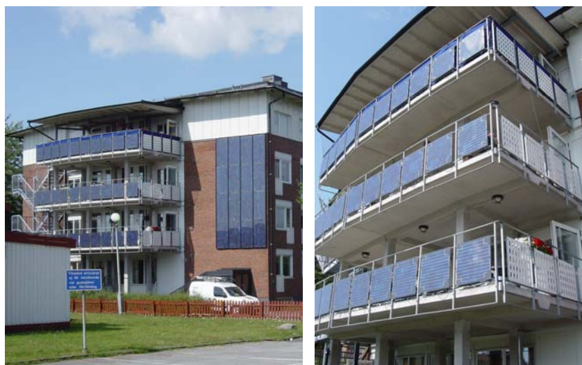
Figur 5. Bilderna är tagna i augusti 2006 och visar den då nyligen färdigställda anläggningen på Bjursläotts äldreboende.

MedicHus är en kommunal förvaltning i Göteborg som är ansvarig för att förvalta särskilda boenden och verksamhetslokaler för äldre och funktionshindrade. De har blivit beviljade stöd för tre solcellsprojekt på ålderdomshem. Två av installationerna är på tak och det tredje, som är betydligt mindre, är placerat på fasaden och integrerat i balkongerna. Den lilla fasad- och balkonganläggningen (Bjurslätt) kommer att driftsättas i augusti 2006 och den ena av takanläggningarna (Solängen) väntas bli klar i mitten på september. Den andra takanläggningen (Åkershus) har däremot blivit försenad eftersom takets bärkraft visade sig vara för dålig. MedicHus hoppas hitta en ny byggnad som kan vara lämplig, i så fall väntas den driftsättas till våren 2007. Bilderna nedan visar Bjursläotts äldreboende.