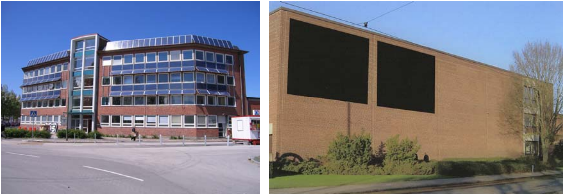
Figur 2. Vänstra bilden visar kårhuset Kajplats 305 och den högra bilden är ett fotomontage som illustrerar solcellsanläggningen på Tekniska museets fasad. Källa: Malmö Stadsfastigheter

Drivkrafterna för att genomföra solcellsprojekten har varit att Malmö Stadsfastigheter vill arbeta mer med energibesparing och genom att arbeta med solceller är det också ett sätt synas och skapa uppmärksamhet. Eftersom de tror tekniken kommer att bli viktig i framtiden tycker de också det är viktigt att vara tidigt ute och lära sig och utveckla kunskap om den nya tekniken. Det är också tydligt hur andra städers satsningar (Freiburg och Köpenhamn) har inspirerat och hjälp till att stärka Stadsfastigheters visioner. En viktig tanke med satsningen är att de själva vill att Malmö också ska bli en inspirationskälla för andra städer. Intrycket av Stadsfastigheters projekt är att det går smidigt utan några större problem och att det inte är några tveksamheter. En viktig orsak till detta är att satsningen har stöd både från ledningen i Stadsfastigheter och från politikerna i Malmö. Även om satsningen hade varit mycket svår att genomföra utan stödet så har den ekonomiska frågan varit mindre betonad i dessa projekt än i exempelvis Ulleviprojektet. Mycket på grund av att Stadsfastigheter fäster stor vikt vid de mervärden som satsningen medför.