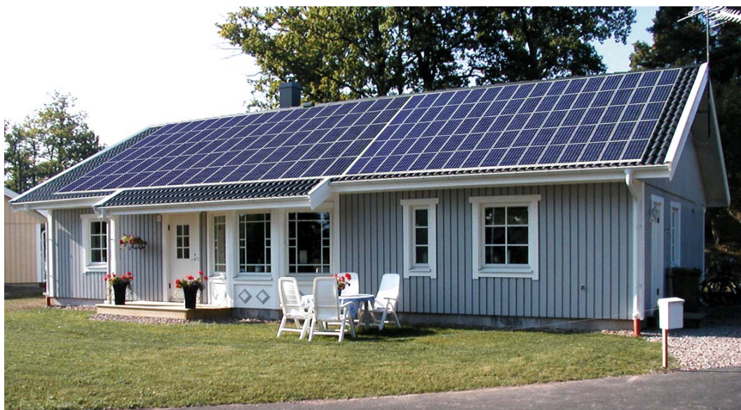
Figur 9. Fotomontage av en av Eksjöhus villor med Ekosols solcellssystem på taket.

Stödprogrammet har bidragit till att öka uppmärksamheten för solceller och alla de nya projekten kommer att göra tekniken mer synlig och skapa ytterligare uppmärksamhet. Genom alla nya projekt och experiment kommer förutom att kunskap om tekniken utvecklas och sprids också brister och barriärer i samhällets ramverk (t.ex. lagar och värderingar) att identifieras. Nya tekniker möter alltid motstånd från de nuvarande dominerande teknikerna och processen för att skapa legitimitet för den nya tekniken och få ramverket att anpassa sig tar ofta lång tid. Men ett tecken på att denna process i alla fall har startat för solcellstekniken i Sverige är att det höjs röster som ifrågasätter ramverket, t.ex. angående avgifterna för att sälja elen.