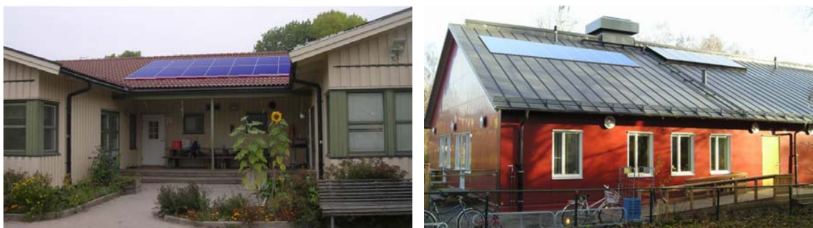
Figur 8. Bilderna visar fotomontage av två förskolor i Älvsjö, Vindleken – Ur & Skur till vänster och Äppelängens förskola till höger.