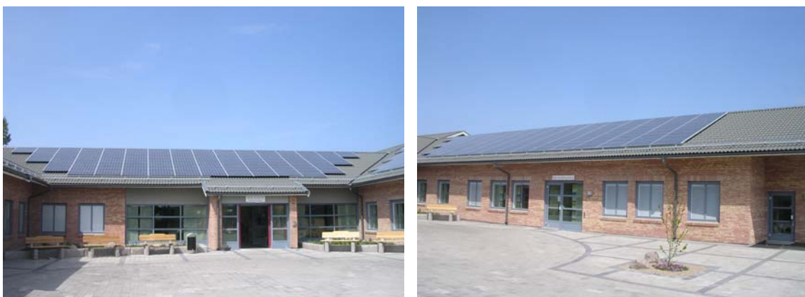
Figur 4. Bilderna är tagna utanför Vårdcentralen i Fjärås i juni 2006 och visar två av de sammanlagt fyra taktytor som belagts med solceller.

Eksta Bostads AB är ett kommunalt bostads- och byggföretag i Kungsbacka. Eksta har sedan 70-talet haft en utpräglad miljöprofil. När det gäller energifrågan är Ekstas policy att energi ska produceras lokalt av förnyelsebara energikällor. De har tidigare fokuserat mest på värme från solfångare och biobränsle. Solfångare har till och med blivit ett sorts signum för Eksta. Men de har också velat göra något åt elförsörjningen och därför var de snabba att reagera när investeringsstödet infördes. De skickade in en ansökan för att bygga en solcellsanläggning på den nya vårdcentralen som de höll på att bygga i Fjärås. Projektet har gått fort och redan i början av 2006 var anläggningen på plats och är dessutom idag den största solcellsanläggningen i Sverige med 64 kW toppeffekt.