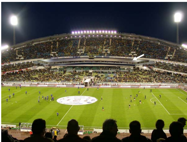
Figur 1. Illustration av VIP-läktaren på Ullevi med solceller på taket.