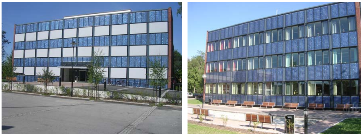
Figur 7. Den vänstra bilden visar den östra fasaden på Alléskolan i Hallsberg och den högra bilden visar den södra fasaden av samma byggnad.

Projektet har bestått i en ombyggnation av en skola där solceller har integrerats i fasaden som en del i detta projekt. Solcellsfasaden är på dryga 400 kvm, kostade 3,5 MSEK och förväntas ge ca 45 kW topp effekt. Flex fasader har varit ansvariga för totalentreprenaden på fasaden. Installationen består av 289 av Schücos glas-glas polykristallina moduler. Arkitekten kommer från White Arkitekter och var också den som kom med idén till solcellsanläggningen.